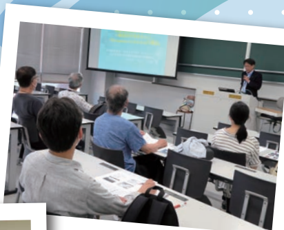
経済安全保障を考える (座学)