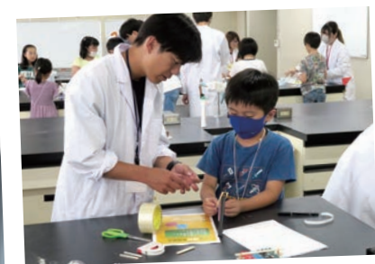
子ども理科実験教室